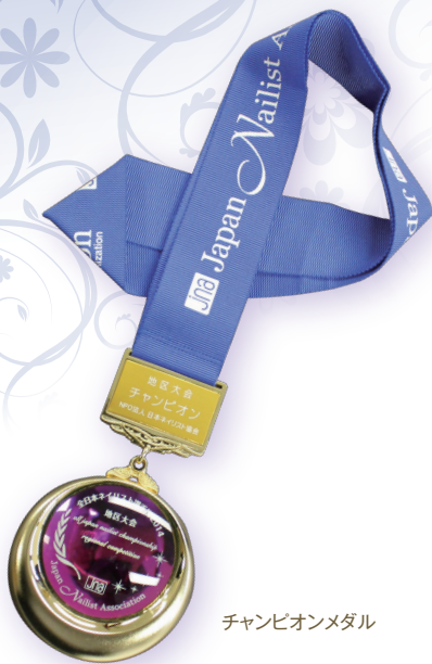
チャンピオンメダル